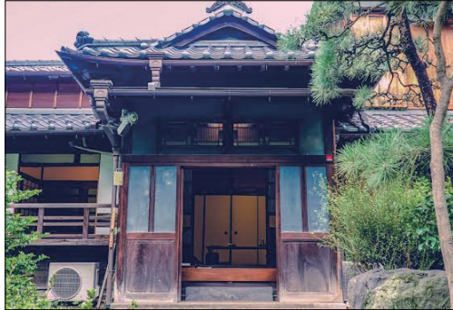
写真1. 外観 (Web サイトより引用)

(施設種別) 高齢者施設 障がい者施設 子ども施設 住宅 ( ) (運営主体) 市区町村 法人 NPO 個人 (補助金) 内閣府 国土交通省 厚生労働省 ( ) (建物形式) 1棟単体型 複数棟集合型 団地型 (建物状況) 新築 増築 改修 一部改修 既存 (対象者) 高齢者 障がい者 子ども ファミリー 多世代