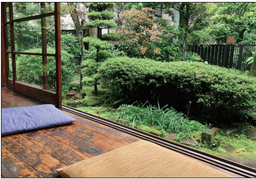
写真4. 施設内で人気の縁側

JR東日本が行う「馬からハイキング」というイベント。見学日もこのようにイベントが開催されていた。