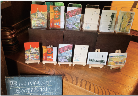
写真3. 開催されているイベント

JR東日本が行う「馬からハイキング」というイベント。見学日もこのようにイベントが開催されていた。