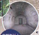
地下作戦室・無線室