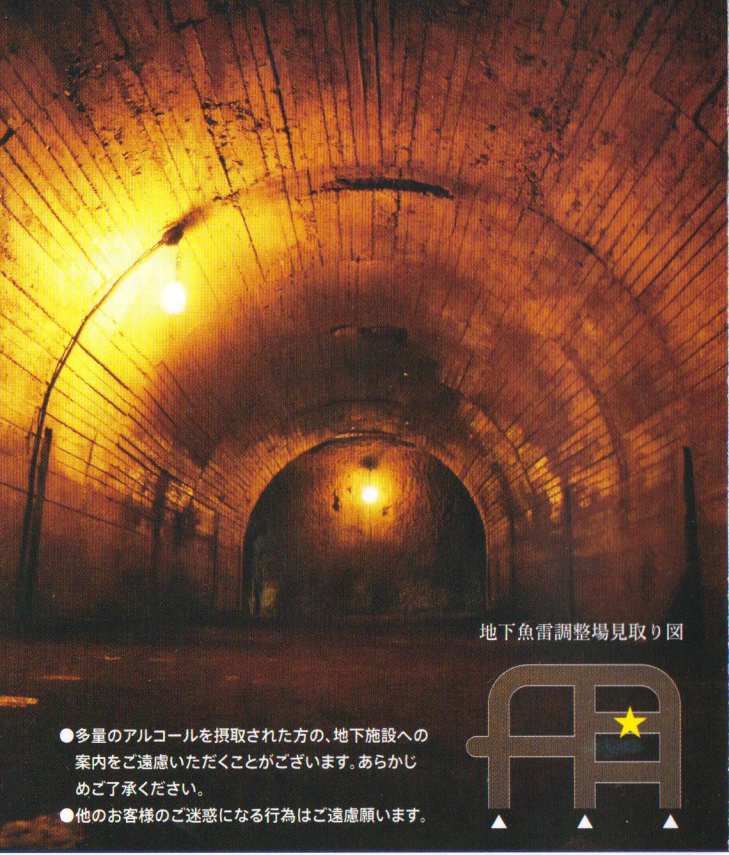
地下魚雷調整場見取り図

1本の壕が幅5m、高さ5m、長さ45m(総延長:233.6m)と、現存する地下施設の中で最も大きな規模を誇る「地下魚雷調整場」にガイド付きでご案内いたします。