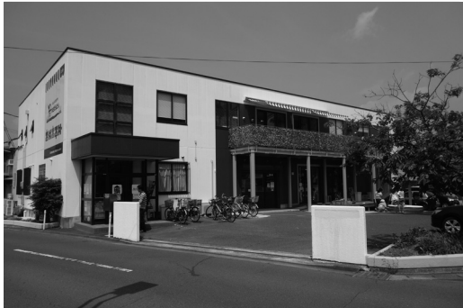
写真1. 外観：周囲に新興住宅地が広がる

〔施設種別〕 高齢者施設 障がい者施設 子ども施設 住宅 () 〔運営主体〕 市区町村 法人 NPO 個人 (補助金) 内閣府 国土交通省 厚生労働省 〔建物形式〕 1棟単体型 複数棟集合型 団地型 (建物状況) 新築 増築 改修 一部改修 既存 〔対象者〕 高齢者 障がい者 子ども ファミリー 多世代