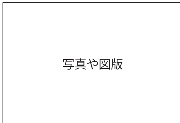
図 or 写真○. タイトル

図版には必要に応じてキャプションをつけてください。図版には必要に応じてキャプションをつけてください。図版には必要に応じてキャプションをつけてください。