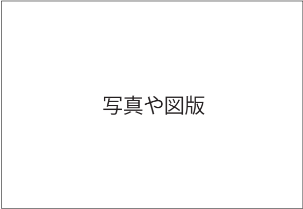
図 or 写真○. タイトル 図版には必要に応じてキャプションをつけてください。図版には必要に応じてキャプションをつけてください。図版には必要に応じてキャプションをつけてください。