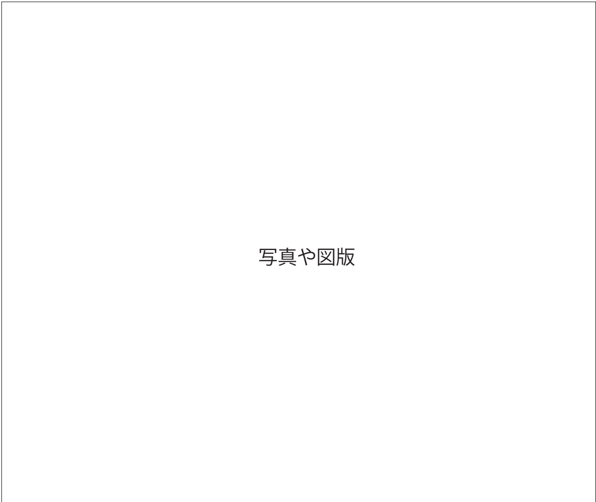
図 or 写真○. タイトル 図版には必要に応じてキャプションをつけてください。図版には必要に応じてキャプションをつけてください。図版には必要に応じてキャプションをつけてください。