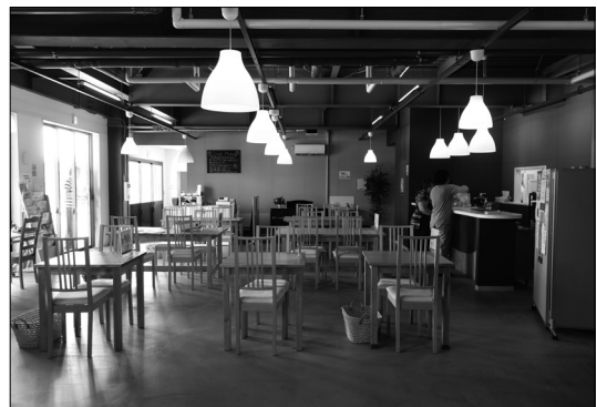
写真2. コミュニティレストラン：倉庫の構造をそのまま転用