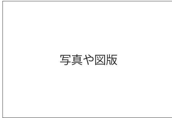
図 or 写真○. タイトル

図版には必要に応じてキャプションをつけてください。図版には必要に応じてキャプションをつけてください。図版には必要に応じてキャプションをつけてください。