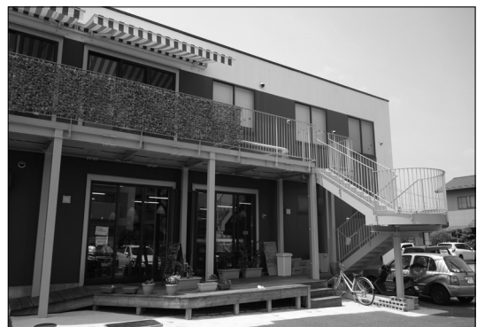
写真3. 増築した外廊下・階段：このデッキや駐車場を使ってマルシェを開催している

震災を契機にそれまで分散していた事業所をまとめることとなった。より広い場所を求めていくつも物件を当たった