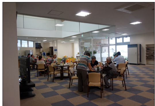
写真3. コミュニティカフェ：奥に幼児コーナー、厨房

地域住民がお互いに支え合う「地域力の向上」を目的としていたので、コミュニティカフェと、地域住民に対する講座などさまざまな活動ができる活動スペースを中心に室構成を考えていった。活動スペースも誰もが講座に気軽に参加できるようにコミュニティカフェスペースの奥の元々脱衣室と大浴