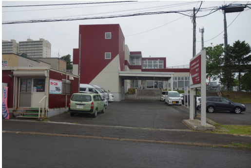
写真1. 前面道路からの外観：手前が増築部

〔施設種別〕 ■高齢者施設 □障がい者施設 □子ども施設 □住宅 () 〔運営主体〕 □市区町村 ■法人 □NPO □個人 (補助金) □内閣府 □国土交通省 □厚生労働省 〔建物形式〕 ■1棟単体型 □複数棟集合型 □団地型 (建物状況) □新築 ■増築 ■改修 □一部改修 □既存 〔対象者〕 ■高齢者 ■障がい者 ■子ども ■ファミリー ■多世代