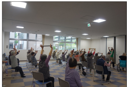
写真2. 交流スペース：毎身体操で使用