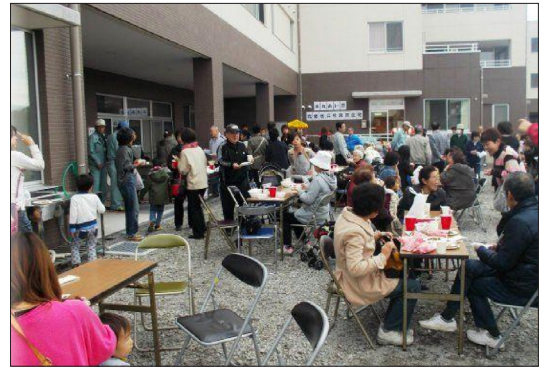
写真7. 第1回ふれあい祭の様子（収穫祭） 敷地内の菜園で収穫したサツマイモやそばを地域住民を招いて皆で食べている。

8) 外国人にあっては、県内市町村に外国人登録をしていて、永住・定住することが認められた方。