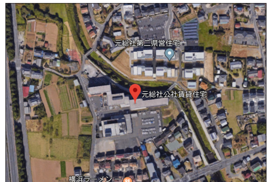
写真2. 周辺状況 (googlemapより)

赤城・榛名・妙義の群馬三山を望める田畑と戸建て住宅に囲まれた場所に位置する。最寄駅からは2km程離れている。