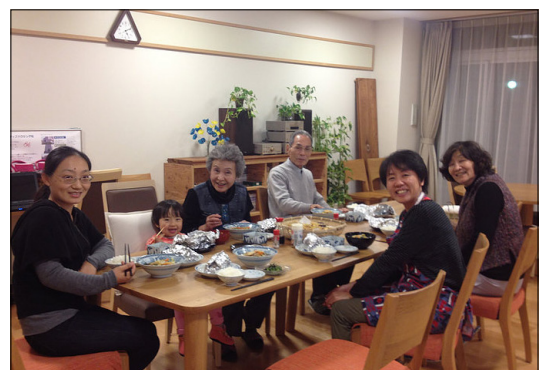
図2. コレクティブハウス元総社コモンズの様子 コレクティブハウス内には共用のLDKがあり、住民同士での交流を定期的に行っている。