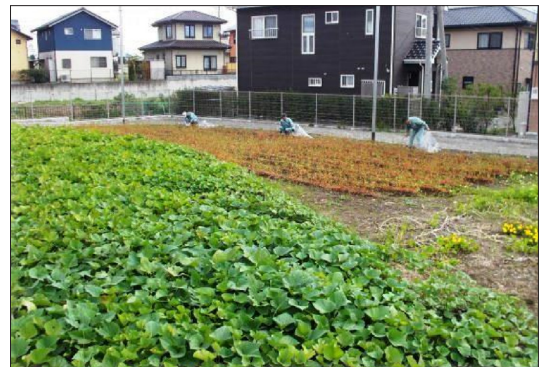
写真8. 菜園の様子 広大な菜園が建物の南側に位置しているため、よく育つ。