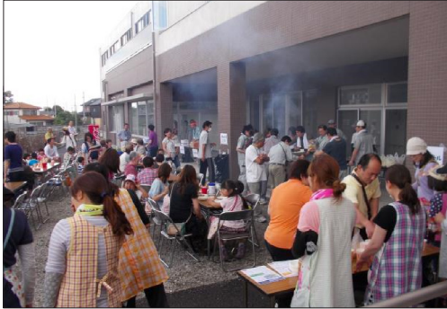
写真1. 開所2周年記念BBQの様子

〔施設種別〕 ■高齢者施設 □障がい者施設 ■子ども施設 ■住宅 ( ) 〔運営主体〕 □市区町村 ■法人 ■NPO □個人 (補助金) □内閣府 □国土交通省 □厚生労働省 ( ) 〔建物形式〕 ■1棟単体型 □複数棟集合型 □団地型 (建物状況) ■新築 □増築 □改修 □一部改修 □既存 〔対象者〕 ■高齢者 □障がい者 ■子ども □ファミリー ■多世代