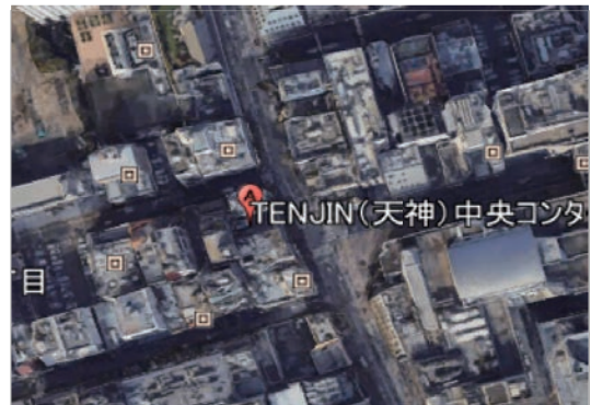
図1. レクルン天神教室航空写真

市営地下鉄の天神駅から徒歩4分に位置する1階にコンタクトレンズのお店が入るビルの5階。周辺には同じくらいの高さのビルが並ぶ。