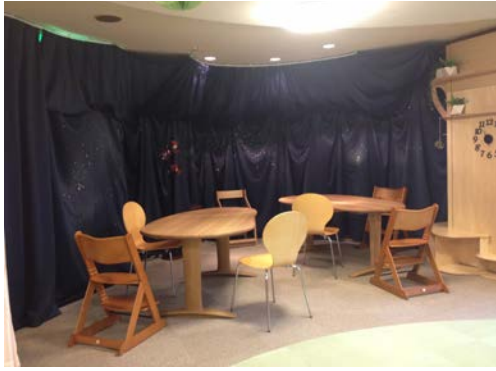
写真3. 星空がイメージされた静的空間 夜空のような黒いカーテンが集中力を高める。