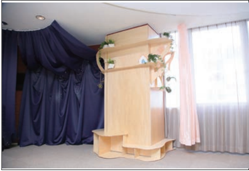
写真1. 教室のシンボル・ツリー「ファピの木」

〔施設種別〕 高齢者施設 障がい者施設 子ども施設 住宅 ( ) 〔運営主体〕 市区町村 法人 NPO 個人 (補助金) 内閣府 国土交通省 厚生労働省 ( ) 〔建物形式〕 1 棟単体型 複数棟集合型 団地型 (建物状況) 新築 増築 改修 一部改修 既存 〔対象者〕 高齢者 障がい者 子ども ファミリー 多世代