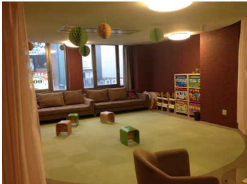
写真4. 木陰がイメージされた動的空間 芝生のような床と壁の色で公園のような空間。

まずコミュニティスペースは壁の絵やカーテンで光、風、はっぱをイメージさせられるようになっている。エレベータで上がってすぐにあるラウンジでは格子状の棚越しに様々な光が入ってくる場になっている。静的空間は窓を覆う夜空のような大きな黒いカーテンに白い星が広がっている。動的空間はシンボルになっているファビの木と茶色い壁面、芝生を敷かれた床にカーテン越しに優しい光が入り公園の木陰のような場所になっている。この静的空間と動的空間の2つの空間は2・3歳児のクラスではレク中に移動して利用しており、それによって子供の気分転換をさせ集中力を継続させる効果がある。このほかにもエレベータ降りてすぐに床に描かれた川では子どもが落ちないように飛んだり、ギリギリを歩いたり子どもの好奇心を刺激し自発的な遊びを生む仕掛けがたくさん詰まっている空間になっている。