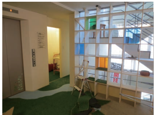
写真2. ラウンジに光を通す棚

市営地下鉄の天神駅から徒歩4分に位置する1階にコンタクトレンズのお店が入るビルの5階。周辺には同じくらいの高さのビルが並ぶ。